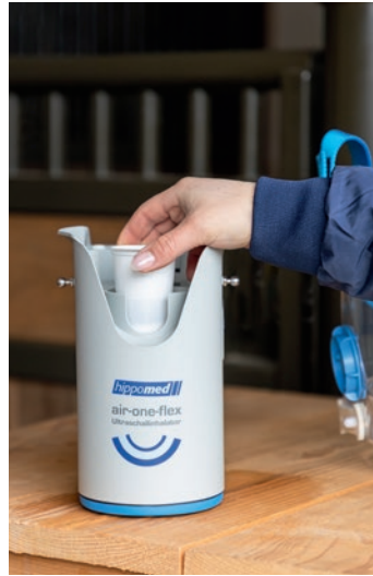
Abb. 2 Kammer 2 (befüllt mit Inhalat) einsetzen.