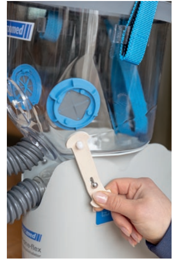
Abb. 4 Maske mit Gummilaschen befestigen und Verbindungsschlauch aufstecken.