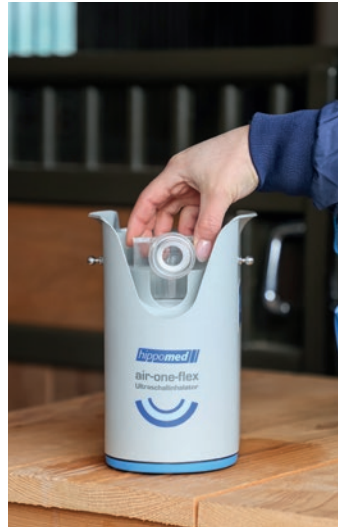
Abb. 3 Nebelkammerdeckel aufsetzen.