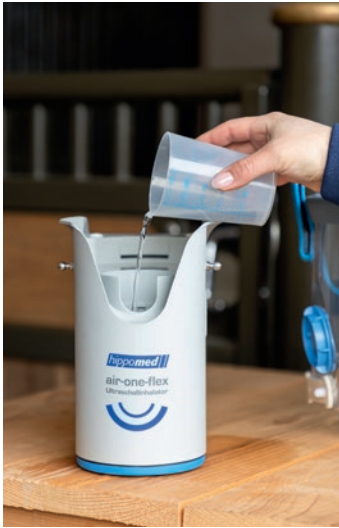
Abb. 1 Kammer 1 mit Kontaktflüssigkeit befüllen.